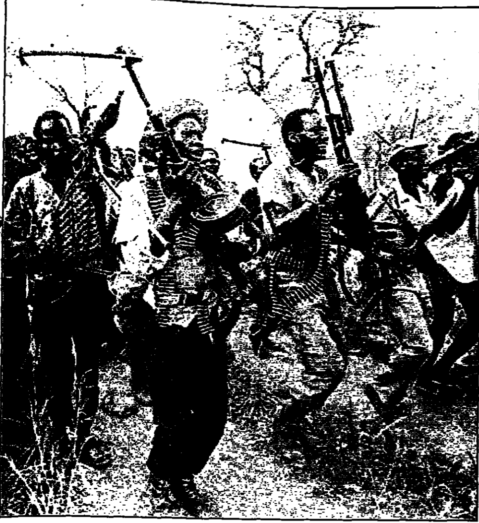
جنود تابعون لحركة فرق

من عيسى آل خليفة ولي عهد دولة البحرين، والشخصيات البارزة في دول الخليج العربية، ويتألف من 80 شخصية خليجية وبريطانية، وذلك في إطار الجهود المبذولة لتعزيز التعاون بين دول المنطقة. وقال الشيخ محمد بن زايد آل نهيان في تصريح له عقب افتتاح المؤتمر، إن هذا الاجتماع يعكس أهمية العلاقات الاستراتيجية بين دول الخليج وبريطانيا، ويهدف إلى تعزيز التعاون في مجالات الأمن والاستقرار والتنمية الاقتصادية. ويشارك في المؤتمر وزراء دفاع دول الخليج، وقيادات عسكرية وسياسية بريطانية بارزة، بالإضافة إلى خبراء في الشؤون الدولية والأمن. ويهدف المؤتمر إلى مناقشة التحديات الأمنية التي تواجه دول الخليج، وتبادل الخبرات، وتعزيز الثقة المتبادلة بين المشاركين. وقد حضر المؤتمر في لندن، وذلك في إطار زيارته إلى بريطانيا، وذلك في إطار زيارته إلى بريطانيا، وذلك في إطار زيارته إلى بريطانيا.